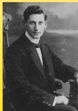
Ludwig Oppenheim – geb. 17. Januar 1893 Ermordet 15. November 1938 in Buchenwald